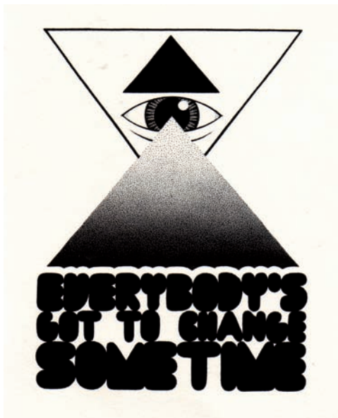
Ewing - encres sur papier