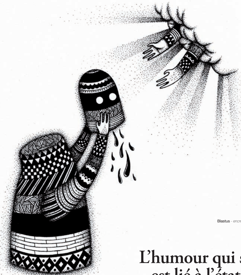
Blastus - encre sur papier